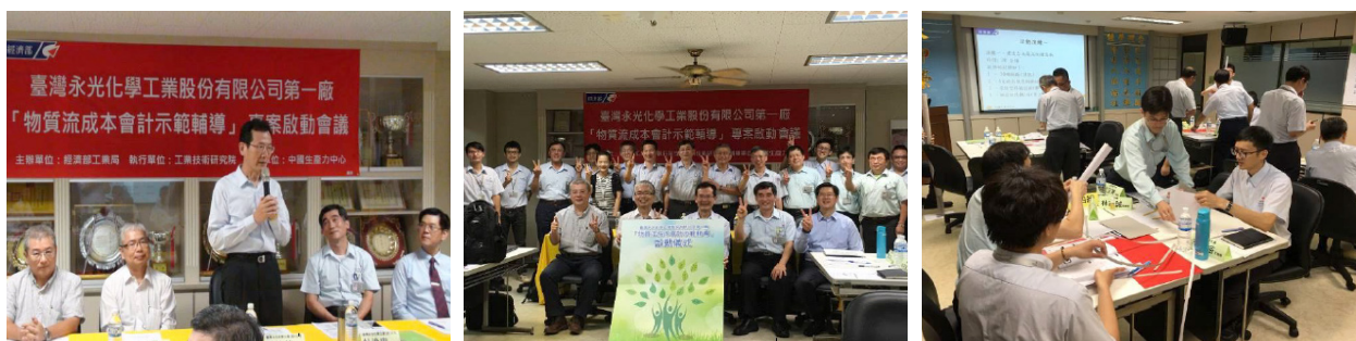
示範輔導「物質流成本會計」啟動會議