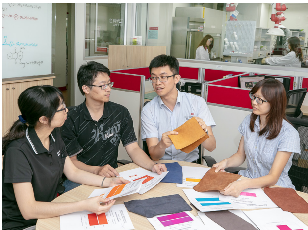
研發團隊致力創新科技，以綠金家園為目標