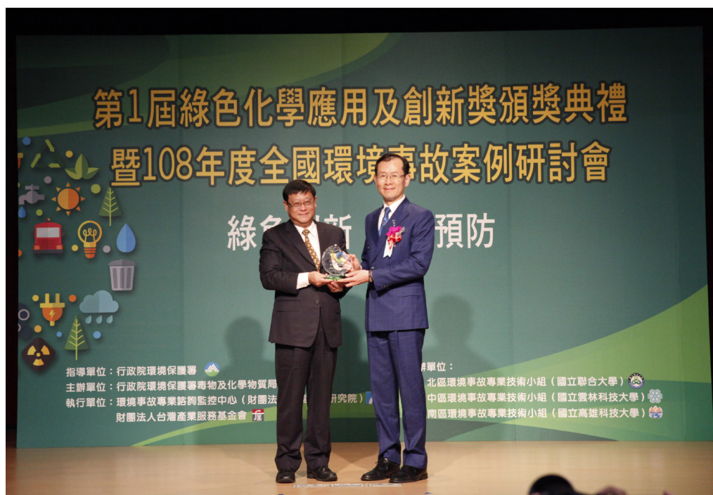
第1屆綠色化學應用及創新獎頒獎典禮