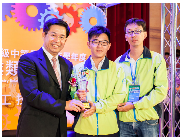
工業類學生技藝競賽 化驗類金手獎 第一名