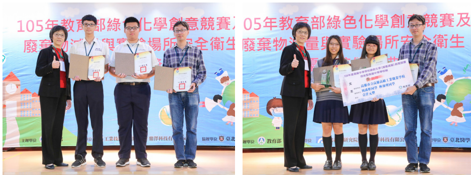
參與高級中等學校綠色化學（減毒減量）創意競賽