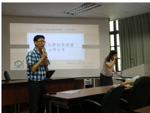
擔任綠色化學創意競賽及專題製作分享研習營講師