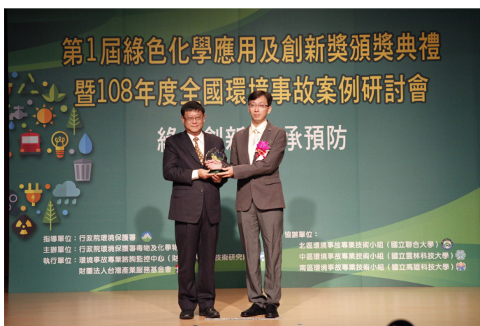
第1屆綠色化學應用及創新獎頒獎典禮